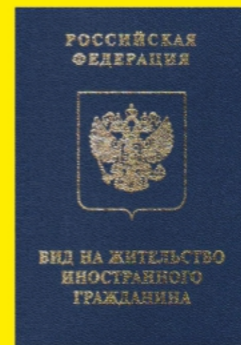
Вид на жительство в РФ