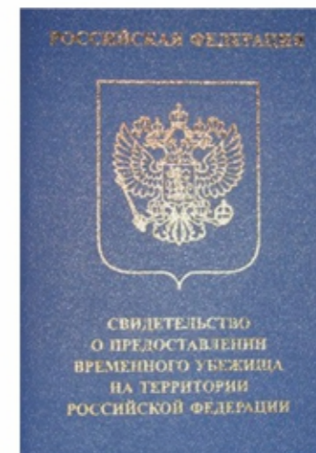
Свидетельство о предоставлении временного убежища на территории РФ