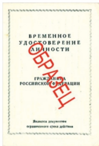
Временное удостоверение личности гражданина РФ