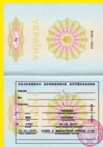
Разрешение на временное проживание в РФ